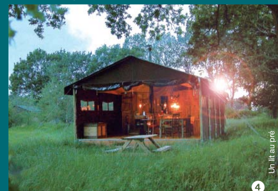
Un lit au pré

D'autres exemples ? www.weekends-picardie.com Le site des bons plans week-ends à moins de 2 heures de Paris.