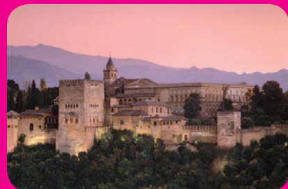
Euroorando l'Alhambra © en attente