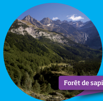
Forêt de sapins